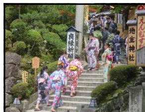
清水地主神社にて