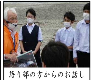
語り部の方からのお話し