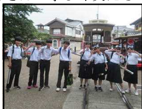
東映太秦映画村にて