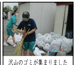
沢山のゴミが集まりました