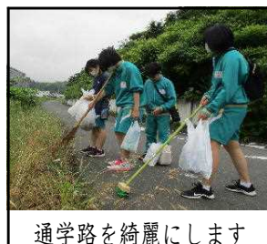
通学路を綺麗にします