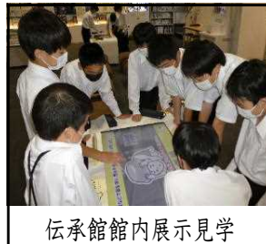
伝承館内展示見学

東日本大震災について、ご家庭でもお話しく下さい。足利市であった地震発生後の夜間停電や計画停電、ガソリン不足、両毛線運休など、どんなことでもかまいません。生徒にとって今の生活が当たり前でないことに気づくことができると思います。