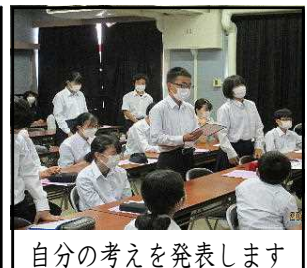
自分の考えを発表します