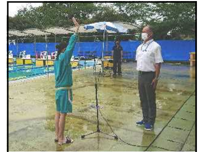
水泳競技 堂々の選手宣誓