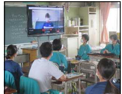
各教室で視聴します