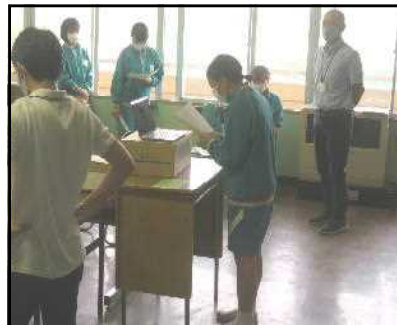
生徒会室から配信します

各部長から総体に臨む意気込み、これまで、苦しかったり、くじけそうになったり、努力してもなかなかうまくいかず悩んだ事、仲間と力を合わせて頑張ってきたこと、支えてくれた保護者への感謝の気持ちなどが発表されました。