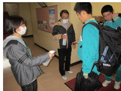
昇降口での消毒の様子

5月も分散登校日を週に一度のペースで設ける予定ですので、引き続きご協力をお願いいたします。